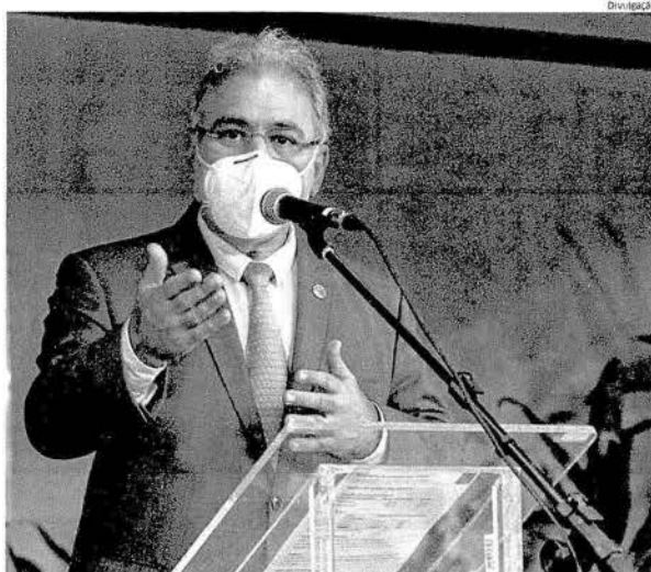
Ministro da Saúde, Marcelo Queiroga, afirmou que o objetivo do Governo Federal é acelerar a vacinação

Segundo ele, o prazo é longo porque há um processo obrigatório a ser seguido que inclui adequações nas instalações de Bio-Manguinhos. "Para que a Anvisa possa vir, na última semana de abril, nos conceder as condições técnico-operacionais. Só aí é que nós poderemos manipular agentes biológicos nessa área. A nossa expectativa é que maio ou